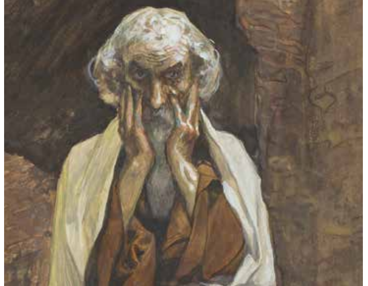
Micha geschilderd door James Tissot (1836-1902), The Jewish Museum New York, gift van de erfgenamen van Jacob Schiff.

Door Micha Nederland is de Micha Zondag in het leven geroepen. Die valt op de zondag het dichtst bij Wereldarmoededag. Dit jaar op 20 oktober. Het thema is 'Zien we het wel? Kijken