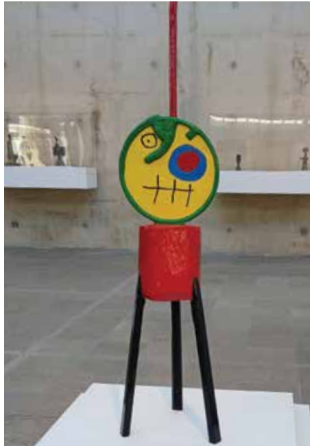
Personage, gemaakt door Joan Miró.